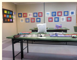
第9回はばたくアート展