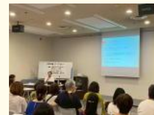
親なきあとについて