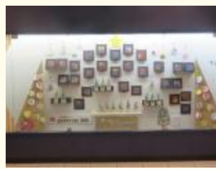
ストリートギャラリー