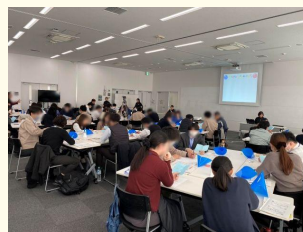
「輪・和・WA」市の職員研修