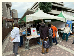
にしのみや市民祭り