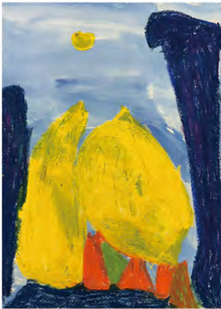
バナナ 山口 顕