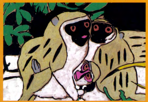
木下晃希 「サルの親子」