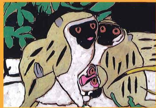
木下晃希 「サルの親子」