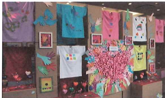
第7回はばたくアート展 (阪急西宮ガーデンズ ガーデンスホール)