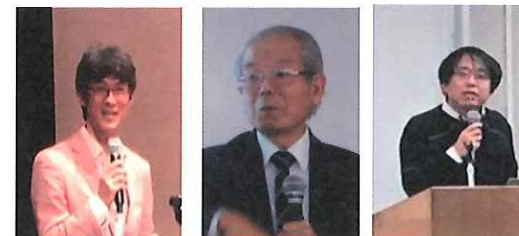
平成29年度 講師の方々